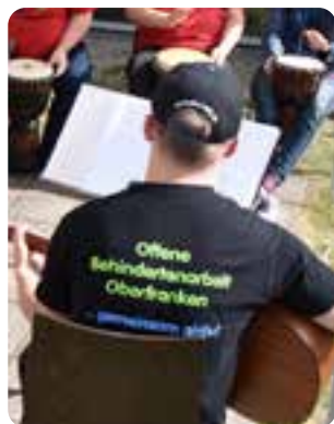
Musik mit der OBO-Band