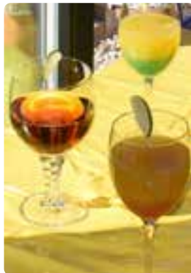
Cocktails vom Treffpunkt