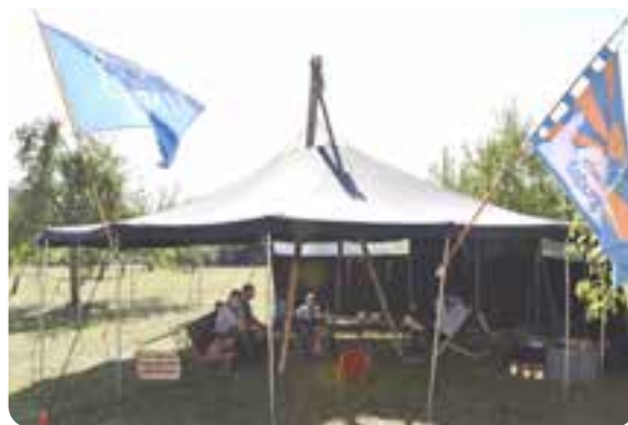
VCP-Pfadfinder in der Jurte