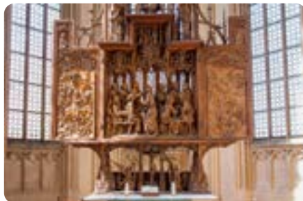
Rothenburg St. Jakob