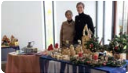
Donnerstagsfrauen beim Adventstag